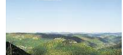
Ein besonderer Ort für Heimatverbundene und ihre Gäste: die Alb.