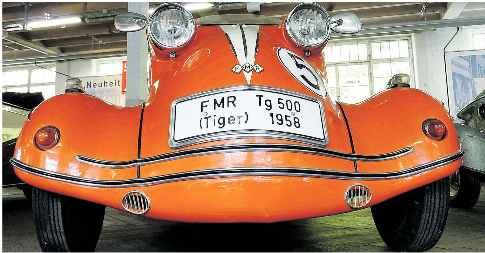
Faszinierend nicht allein für ausgesprochene Autofans: ein Messerschmitt „Tiger“ aus dem Jahr 1958 in Schramberg.