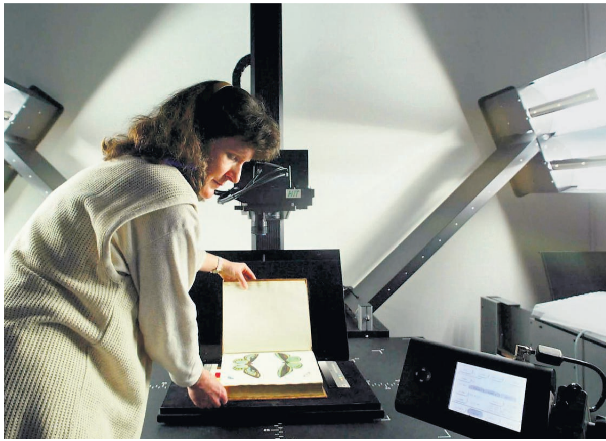
Digitalisierung von Bibliotheksgut ermöglicht optimale Recherche und besseren Schutz der Originale.

Ziel der Bibliothek, die als Gemeinschaftsprojekt von Bund, Ländern und Kommunen aufgebaut wird, ist es, einen zentralen Zugang zu Informationen aus mehr als 30000 Kultur- und Wissenschaftseinrichtungen zu schaffen. Die wesentlichen Grundlagen dafür sind in einem Eckpunktepapier enthalten, das vom Bundeskabinett am 2. Dezember 2009 beschlossen wurde. Die anfänglichen Investitionskosten werden hier mit 1,3 Millionen Euro beziffert, Betrieb und Fortentwicklung mit rund 2,6 Millionen Euro pro Jahr. Die Kosten tragen Bund und Länder je zur Hälfte. Außerdem