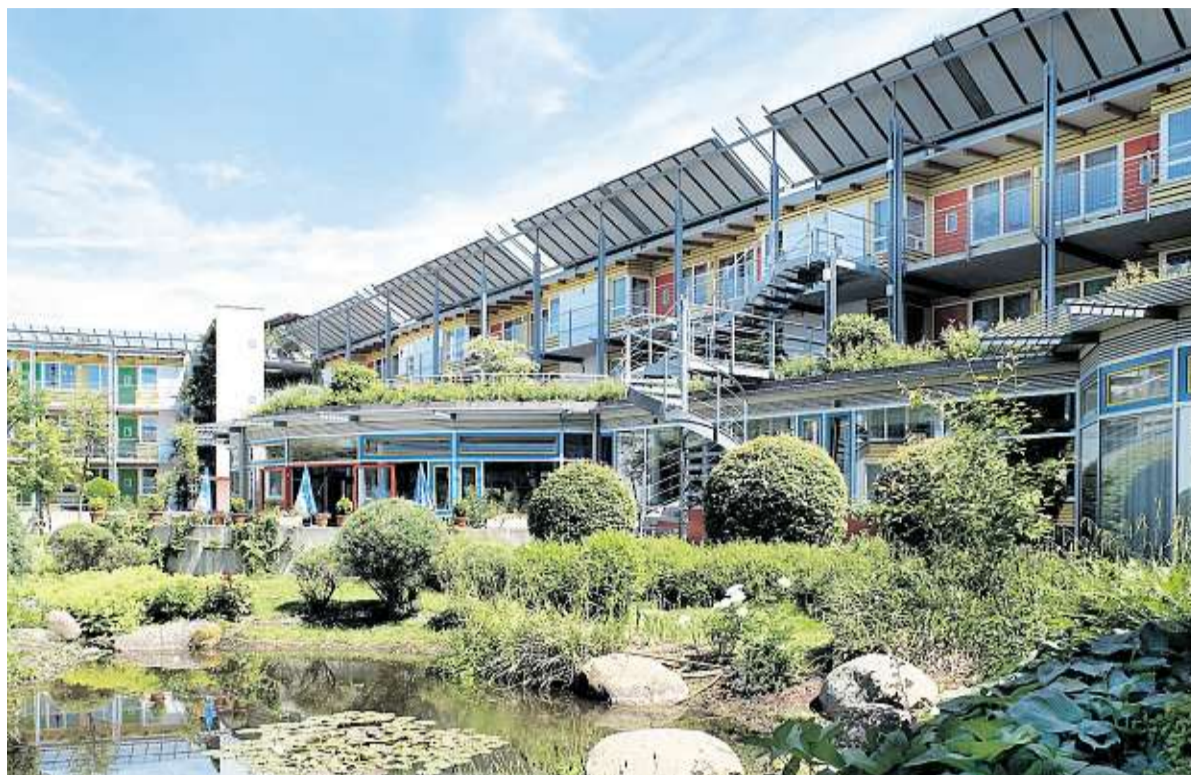
Energieeffiziente Seniorenwohnanlage in Emmendingen des Architekten Rolf Disch. FOTO: ARCHITEXURBÜRO ROLF DISCH

Beispiel Passivplushaus – eine Bauart, bei der Bewohner am Ende des Jahres sogar noch Geld herausbekommen. Das Modell funktioniert längst: Die Energie einer Photovoltaikanlage auf dem Dach des Objekts wird in das öffentliche Stromnetz eingespeist. Wärme im Winter wird nicht allein von der Sonne, sondern durch Erdwärme mithilfe einer Wärmepumpe gewonnen. Das Erdreich bringt wiederum im Sommer kühle Luft in die Wohnungen, die mit einer ganz speziellen Dämmung versehen sind. „Das alles kostet 200 bis 300 Euro mehr pro Quadratmeter“, rechnet Hans-Dieter Brand, Geschäftsführer von Nord-Süd Hausbau in Stuttgart. Geld, das offenbar nur wenige bereit sind, aus-