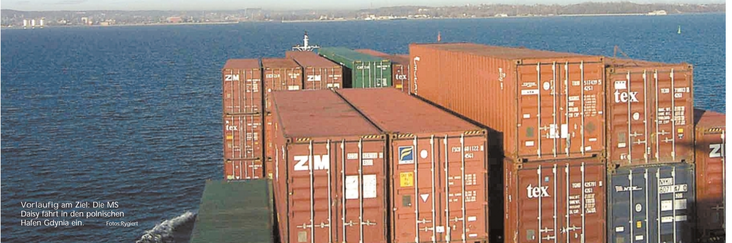
Vorläufig am Ziel: Die MS Daisy fährt in den polnischen Hafen Gdynia ein.

Panik. Der Steuermann weigert sich, von Bord zu gehen. Er will seine Pfeifensammlung nicht im Stich lassen. „Ich musste ihn ohrfeigen, sonst wäre er mit untergegangen.“ Bucher selbst hat sogar noch die Maschinen abgeschaltet. Damit sie noch zu brauchen sind, wenn man das Schiff wieder hebt. Von der alten Seemannsromantik, falls es die jemals gegeben hat, ist nichts