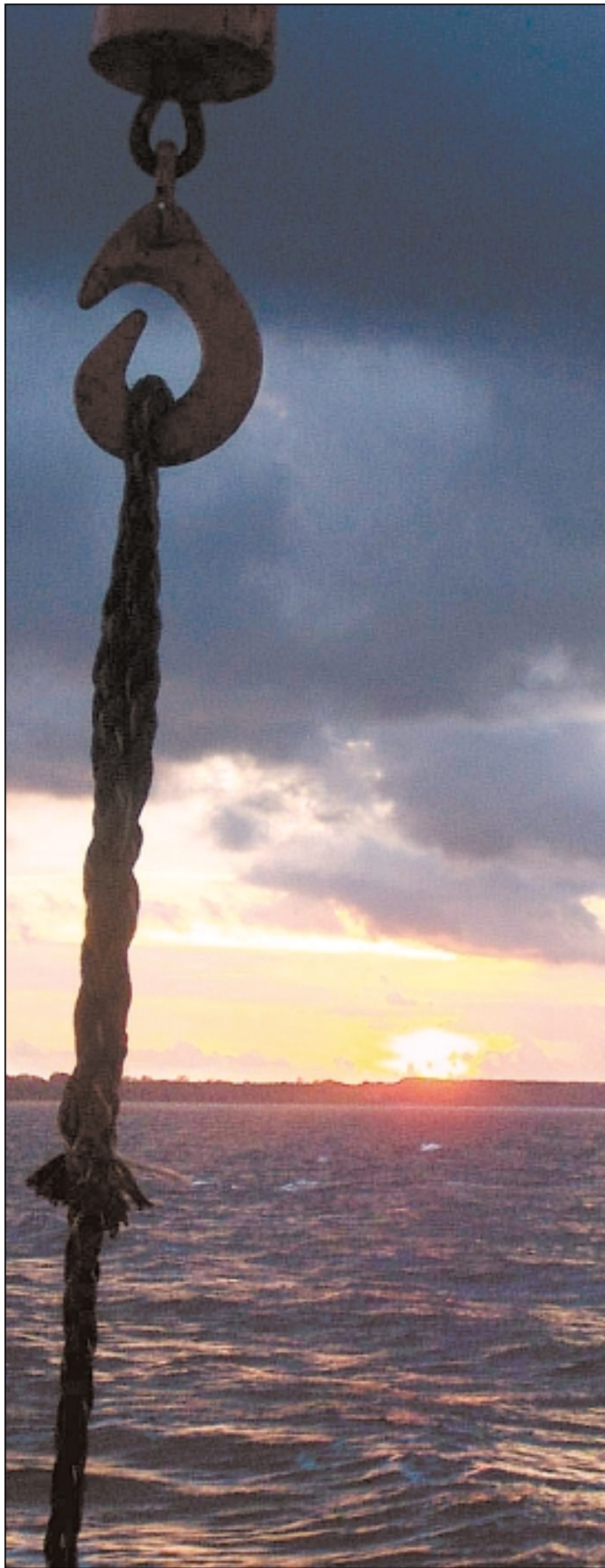
Das Land vom Meer aus betrachten: Abendstimmung vor der Insel Rügen.

Bucher hat die Welt gesehen, es gibt kein Land auf dieser Erde, in dem er nicht schon mal angelegt hat. Heute ist er schon fünf Jahre über der Rente,